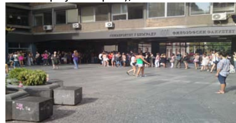
Redovi ispred Stilosa – sada su prošlost

na račun fakulteta, a poziv na broj će biti ujedno username naloga za elektronsku prijavu ispita, koji se sastoji od šifre odeljenja, godine upisa i broja indeksa, što će omogućiti lako pamćenje. Na nalogu će studenti imati uvid svojih uplata, a neiskorišćeni novac ostaje za naredne rokove. Studenti će, pored mogućnosti prijave ispita, moći da prate unos položenih ispita u okviru studentskog dosijea. Od sledeće jeseni se planira da studenti vrše prijavljivanje predmeta za 2012/13. elektronskim putem umesto dosadašnjeg PP obrasca. Studenti prilikom upisa od 10.10. do 28.10.2011. godine mogu popuniti EPI (elektronska prijava ispita), obrazac za aktiviranje naloga za elektronsku prijavu ispita. Obrazac će dobiti na šalteru prilikom predaje dokumenata za upis, popuniti ga na licu mesta i ostaviti na samom šalteru. U obrazac se unosi ime i prezime, broj indeksa i e-mail adresa. Brucoši i ostali studenti osnovnih studija koji su se već upisali od 3.10. do 7.10.2011 kao i studenti master i doktorskih studija, mogu preuzeti, popuniti i ostaviti obrazac na šalteru 5, radnim danom od 12 do 15 časova. Studenti i posle upisnog roka mogu popuniti EPI obrazac na šalterima studentske službe. Važno je da pri popunjavanju student ima kod sebe indeks da bi se utvrdio identitet kako ne bi došlo do zloupotrebe naloga. Studentu će na e-mail stići aktivacioni link preko koga će kreirati svoj nalog i šifru.